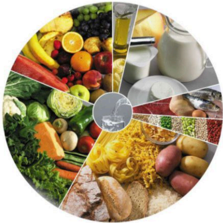
Roda dos Alimentos