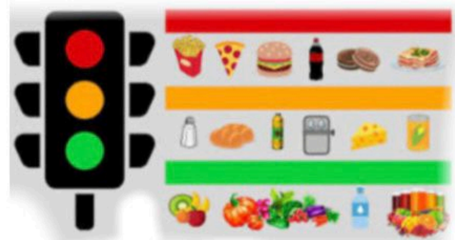
Semáforo da alimentação